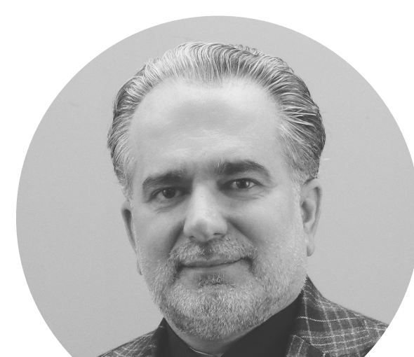
مدیر گروه دوره