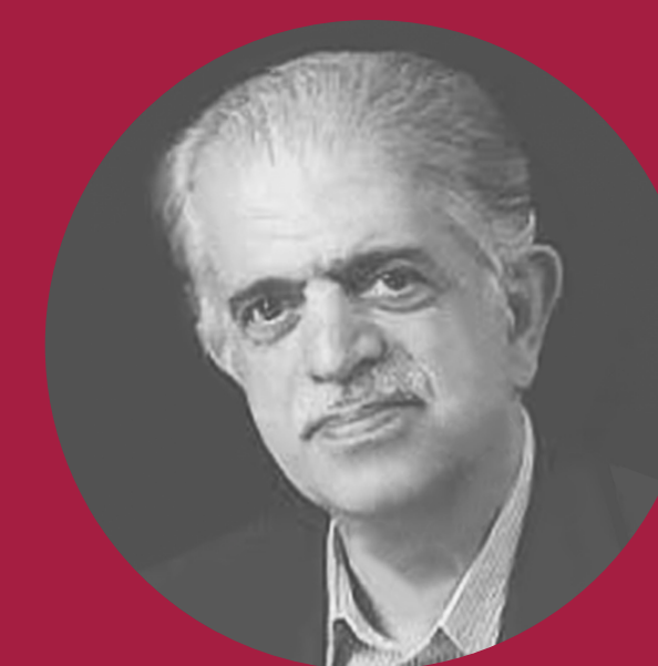
پروفسور مهدی الوانی