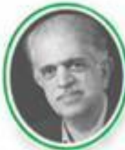
پروفسور مهدی الوانی